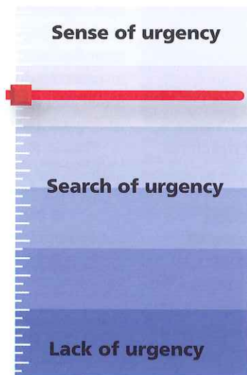
Figuur 1. De urgentiemeter.

Definitie van urgentie: In hoeverre zijn partijen zich bewust van een probleem/kans en beleven dat als dringende noodzaak tot handelen.